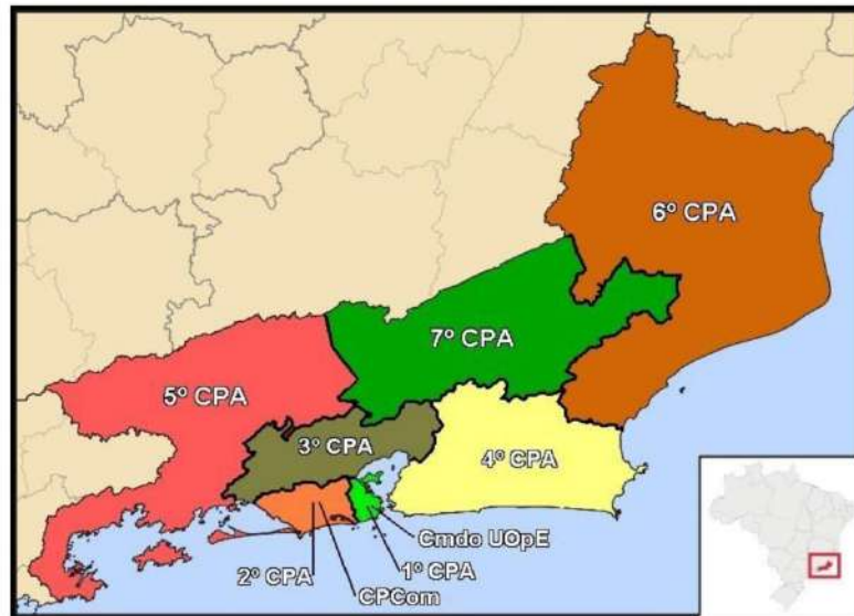
Figura 2. Regiões de Comando de Policiamento de Área (CPA) da SEPM. 2

Em tese, o ensejo para esta alternativa teria como sustentáculo a obtenção de melhores cotações junto aos fornecedores mediante a possível redução do custo logístico de frete e ampliação da competitividade, o incentivo ao microempreendedor e promover uma logística mais sustentável com o fomento ao desenvolvimento local.