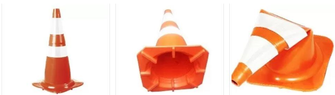
Figura 1: cone flexível