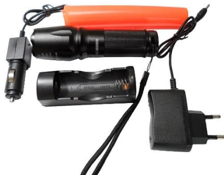
Figura 5: Lanterna tática policial recarregável