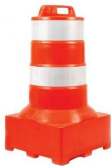
Figura 3: cilindro canalizador de tráfego