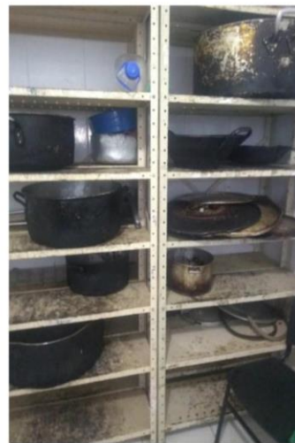
Fotos 1 e 2: estantes em mal estado de conservação- Ranchos SEPM/2020