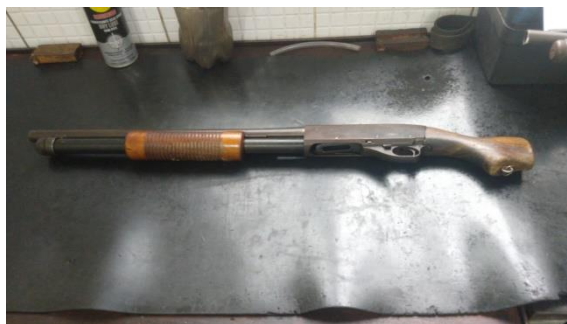
Espingarda CBC Modelo 586.2

4.2 Do total desse tipo de arma em carga da SEPM, 500 espingardas são do tipo CBC Modelo 586.2, adquiridas no ano de 1995. Além disso, possuem coronha curta, o que inviabiliza o enquadramento adequado do alvo (não possibilita a empunhadura e visada de forma segura pelo operador). Veja a imagem do armamento mencionado: