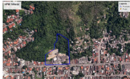
Figura 1: Estimativa do terreno

A descrição da área do hospital replica informações coletadas no documento da diretoria Geral de Apoio Logístico – 4ª seção (Engenharia de Patrimônio), fornecido pela unidade, a qual referência a respeito da escritura de compra e venda lavrada às fls 100v do livro 1 no cartório do 9º ofício em 26/03/1937.