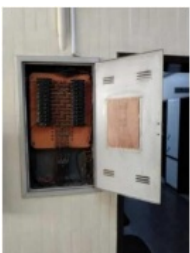
Figura 10 - Quadro de Distribuição instalado próximo à recepção da unidade (térreo) – Limpeza dos barramentos de terra e neutro, limpeza dos conectores terminais nestes barramentos e instalação de conectores nos terminais dos condutores que não possuem esta conexão; limpeza dos conectores terminais em todos os disjuntores, inclusive os no disjuntor principal,