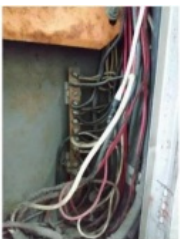
Figura 14 - Quadro de Distribuição ao lado do banheiro masculino (térreo) - Serviços de manutenção preventiva urgentemente.