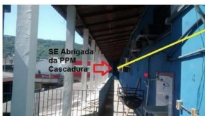
Figura 06 - Instalação de um novo ramal trifásico de 95 mm 2 , em substituição ao ramal de 70 mm 2 existente, incluindo o neutro, derivado dos barramentos de fase e neutro dentro da SE Abrigada (sinalado na figura.), num percurso aproximado de 60 metros (ver linha amarela), a ser conectado no Quadro de distribuição com proteção de 225 A.