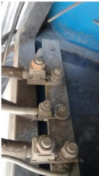
Figura 04 - Limpeza e reaperto dos conectores e barramentos neutro.