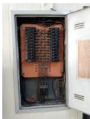
Figura 17 – Quadro de Distribuição localizado em frente a Diretoria e Secretaria P1(2º piso) - Limpeza dos barramentos de terra e neutro, limpeza dos conectores terminais nestes barramentos e instalação de conectores nos terminais dos condutores que não possuem esta conexão; limpeza dos conectores terminais em todos os disjuntores, inclusive os no disjuntor principal.