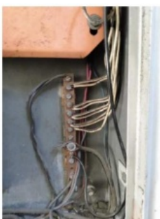
Figura 18 – Quadro de Distribuição localizado em frente a Diretoria e Secretaria P1 (2º piso) - Serviços de manutenção preventiva urgentemente.