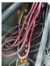
Figura 16 - Quadro de Distribuição ao lado da sala da Nutricionista/Endocrinologista/Dermatologista (2º piso) - Serviços de manutenção preventiva urgente.