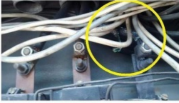
Figura 07 - Substituição de trecho do condutor danificado marcado na figura – Terceiro terminal da esquerda para direita (Utilização de caixa de emenda).