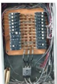
Figura 15 – Quadro de Distribuição ao lado da Nutricionista/Endocrinologista/Dermatologia (2º piso) - Limpeza dos barramentos de terra e neutro, limpeza dos conectores terminais nestes barramentos e instalação de conectores nos terminais dos condutores que não possuem esta conexão; limpeza dos conectores terminais em todos os disjuntores, inclusive os no disjuntor principal.