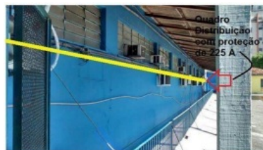
Figura 05 - Instalação de um novo ramal trifásico de 95 mm 2 , em substituição ao ramal de 70 mm 2 existente, incluindo o neutro, derivado dos barramentos de fase e neutro dentro da SE Abrigada, num percurso aproximado de 60 metros (ver linha amarela), a ser conectado no Quadro de distribuição com proteção de 225 A sinalado na figura.