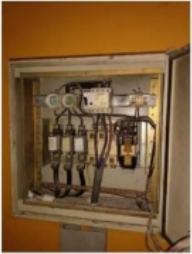
Figura 12– Quadro de automatizado do Raio-X (térreo), limpeza e reaperto de todos os contatos.