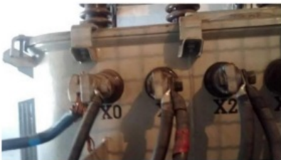
Figura 01 - Utilização de terminais adequados nas extremidades de cada condutor a ser fixados no terminal X0 do transformador de 112,5 KVA instalados na SE Abrigada da PPM Cascadura.