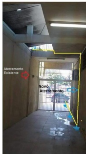
Figura 09 - Novo sistema de aterramento (Padrão LIGHT) – Condutor nu de 35 mm 2 de cobre; eletroduto, caixa de aterramento, 03 haste. O aterramento atual deverá ser mantido.