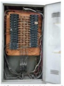
Figura 13 - Quadro de Distribuição ao lado do banheiro masculino (térreo) - Limpeza dos barramentos de terra e neutro, limpeza dos conectores terminais nestes barramentos e instalação de conectores nos terminais dos condutores que não possuem esta conexão; limpeza dos conectores terminais em todos os disjuntores, inclusive os no disjuntor principal.