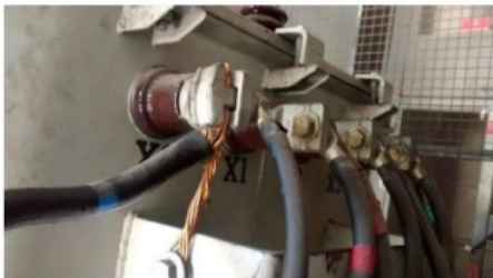
Figura 02 - Instalação de um novo sistema de aterramento padrão LIGHT, hastes a ser instalada no piso inferior (garagem) - Manter o sistema atual de aterramento e instalar um novo aterramento. Utilização de terminais adequados nas extremidades de cada condutor a ser fixados no terminal X0 do transformador de 112,5 KVA instalados na SE Abrigada da PPM Cascadura.