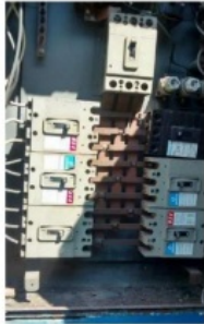
Figura 08 - Limpeza e reaperto das conexões, nos bornes dos disjuntores, limpeza dos barramentos, utilização de conexões terminais nas fixações dos condutores neutros nos barramentos existentes no quadro.